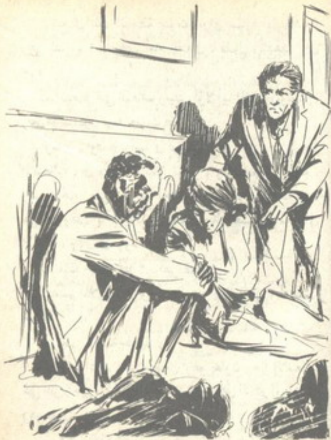
زفر ( براون ) في خنق ، وجلس أرضاً إلى جوار ( منى ) وأشعل سيجارته في عصبية

زفر ( براون ) في خنق ، وجلس أرضاً إلى جوار ( منى ) ، وأشعل سيجارته في عصبية ، ولوح بكفه ، وهو يقول ساخطاً : — لو أن الأمر بيدي ، لأطلقت النار على رؤوسهم دون تفكير ، ولكنها الأوامر .